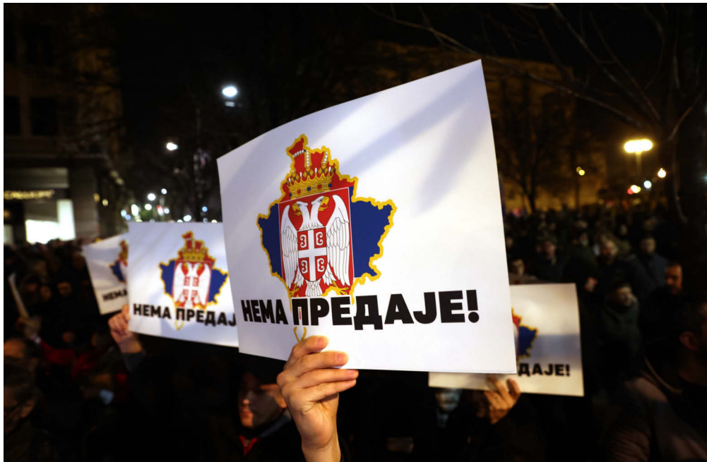
Protest Februarja so v Beogradu na pobudo desničarskih sil demonstrirali proti dogovoru s Kosovom

Čprav ustava določa, da je Srbija parlamentarna demokracija, dejansko o vsem odloča predsednik Aleksandar Vučić. Sploh Srbi ljubijo enega voditelja; nekoč je bil to Milošević, danes je Vučić. Srbija je policijska država,